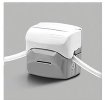
4. 向下合上泵头翻盖，完成软管安装。