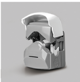
1. 向上掀开泵头翻盖，打开泵头。